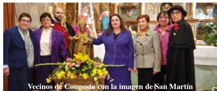
Vecinos de Congosta con la imagen de San Martín