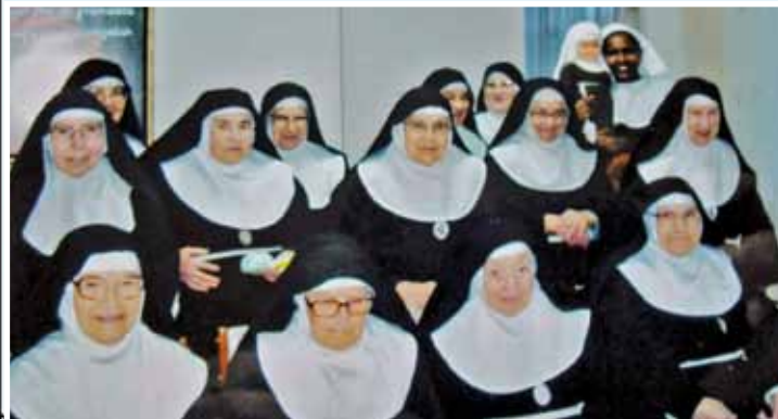
Varias hermanas de la comunidad.