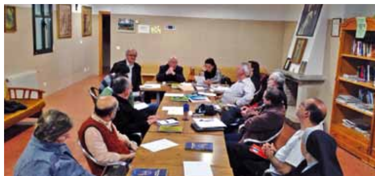
Reunión en Ponferrada

Justamente ahora que los aspectos de atención humanitaria están mejor garantizados por esta oferta tan plural, surge la necesidad de ofrecer una acogida más identificada. Cada uno debe estar en el Camino como lo que es, y la Iglesia está para hacer presente a Cristo y conducir a un encuentro con él, porque cree firmemente que sólo él sacia de verdad el hambre y la sed, cura de verdad las heridas del alma, y alivia el cansancio del corazón del hombre. Que él es la meta y el sentido de todo peregrinar humano.