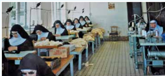
En el taller de confección de ropa interior de mujer para Teleno.

Aunque en la actualidad se encargan de las labores domésticas y del cuidado de las hermanas mayores, las clarisas de Astorga han realizado a lo largo de su estancia en la ciudad muchas actividades para el exterior como la confección de ornamentos de Iglesia, de abrigos para niños, buzos y trajes de esquiar, prendas de enfermería y trajes de Semana Santa y también confección de ropa interior de mujer para Teleno. Tiempo atrás el cultivo de la huerta de la casa y el cuidado de animales, ya que tenían una pequeña granja, eran sus principales ocupaciones, ya que cuentan con 20.000 m 2 de extensión.