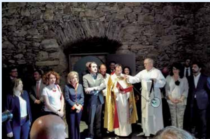
Bendición en el interior del monasterio

Estas obras, promovidas por la Real Fundación Hospital de la Reina , han supuesto un presupuesto de casi un millón de euros, financiado por el Ministerio de Fomento (el 50% de la inversión), a través del Programa 1,5% Cultural; por la Consejería de Fomento de la Junta de Castilla y León (el 40%), y el resto por la Real Fundación Hospital de la Reina. La nueva sala polivalente requirió la instalación de una estructura interna de madera y la reconstrucción de los muros de piedra. Las obras fueron ejecutadas por la empresa especializada Trycsa, que había sacado adelante proyectos en fortalezas bercianas como el castillo de Ponferrada o el de Cornatel .