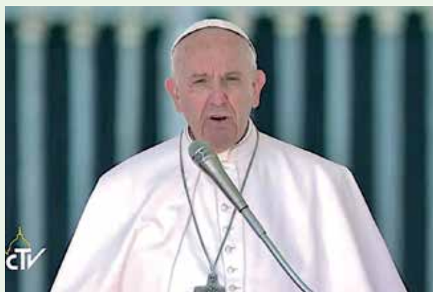
Audiencia General (Osservatore @ Romano)

Jesús camina, de manera discreta, junto a todas las personas desalentadas, y logra darles de nuevo la esperanza. Como a los discípulos de Emaús, él habla a través de las Escrituras, manifestando cómo la verdadera esperanza pasa por el fracaso y el sufrimiento. Y al final del camino cumplido en su compañía, Jesús se hace reconocer en la Fracción del pan , gesto fundamental de la Eucaristía, don de su amor total, de donde brota la vida de la Iglesia y del cristiano.