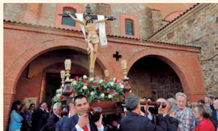
La imagen del Cristo saliendo del templo de Santa Cristina