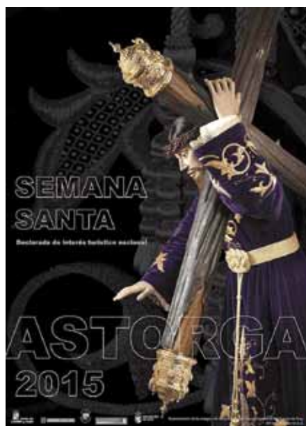
Cartel Semana Santa Astorga 2015

El cartel anunciador de la Semana Santa de Astorga 2015 muestra la imagen del Nazareno de Puerta de Rey con motivo de la celebración de su bicentenario. Una fotografía de Imagen M.A.S nos enseña la nueva cruz arbórea que la Real Cofradía de N. Padre Jesús Nazareno y María Santísima de la Soledad ha encargado a un artista sevillano.