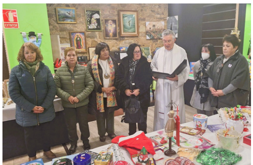
Rastrillo La Bañeza