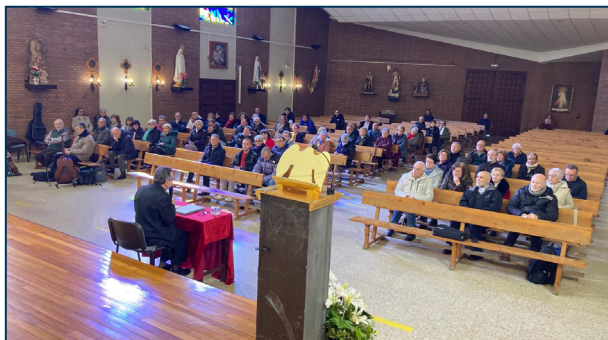
Retiro en O Barco

Tras un primer momento de bienvenida e invocación al Espíritu Santo, tenía lugar la meditación titulada "Dios nos sale al encuentro", en la que don Javier propuso contemplar cómo Jesús se acerca a distintas situaciones vitales: la de una persona alejada, representada en la samaritana; la de un hombre religioso, Nicodemo; y la de quienes ya han sido llamados y comprometidos con Él, los apóstoles.