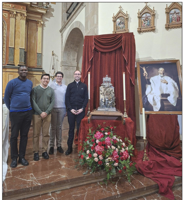
Los seminaristas y el rector con las reliquias

Durante la homilía, recordó la importancia de seguir rezando y colaborando con el seminario, así como de fomentar las vocaciones al sacerdocio. También destacó el valor de haber contado con la reliquia de San Juan de Ávila y dio gracias a Dios por la vida y el servicio de los sacerdotes y de los seminaristas.