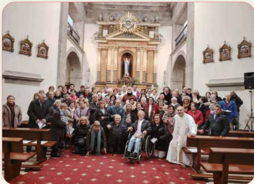
(En la imagen: asistentes a la jornada)