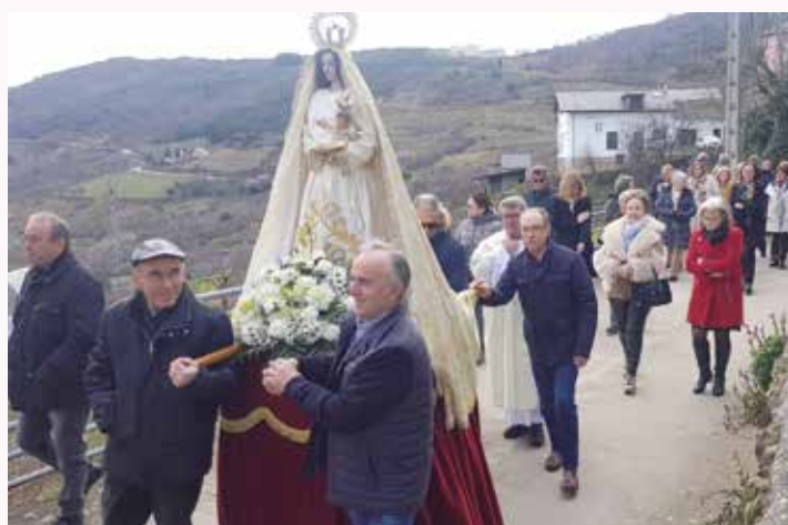
Procesión con la imagen de la Virgen