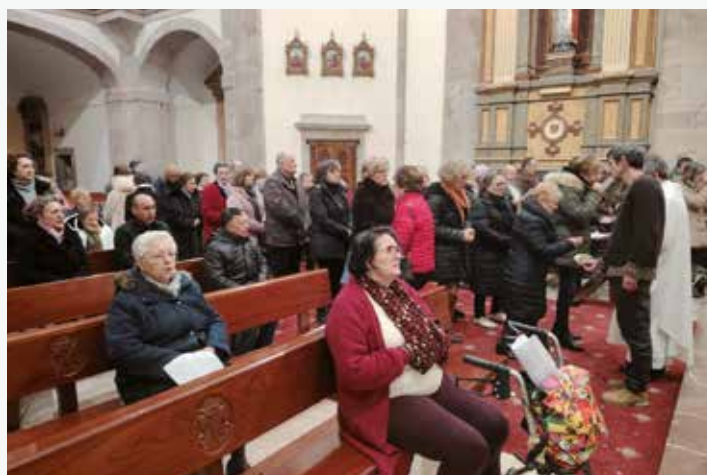
Asistentes a la jornada