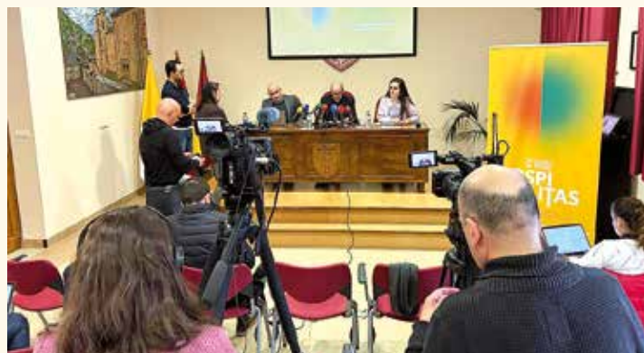
Un momento de la presentación en Ponferrada