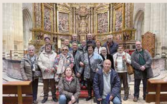
Feligreses de la zona de Trives con su párroco