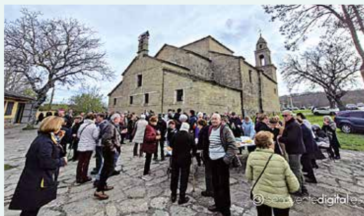
Merienda de clausura

Esta Visita Pastoral del obispo de Astorga a la Upa Sanabria se cerraba con una merienda en la explanada del santuario bajo los sonos musicales de Gaiteros Colino.