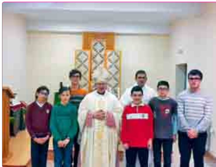
El Sr. Obispo con los seminaristas menores.

En las aulas que el Sr. Obispo visitó, saludó cordialmente al profesor y se dirigió a los alumnos en tono desenfadado y alegre, invitándoles a aprovechar esta etapa académica y a confiar en Jesucristo mediante la oración de cada día y la cercanía a la Iglesia. También bromeó con algunos de ellos, haciendo honor a su fama de persona cercana y afable.