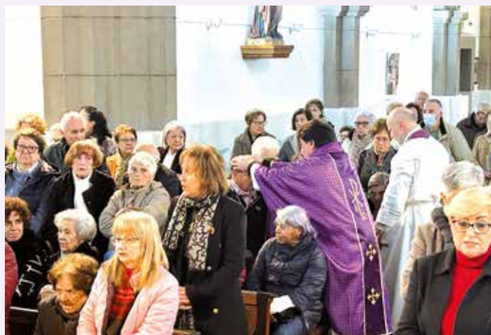
Un momento de la unción

Fue una celebración de gran gozo en para todos, en la que pudimos compartir el sufrimiento de los enfermos y ponerlo a los pies de Nuestro Señor Jesucristo, para que él, que padeció en la cruz por todos nosotros, lo bendiga y santifique, pidiendo también la sanación corporal y espiritual para todos ellos.