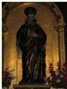
San Vicente de Paúl