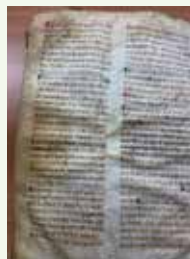
Libro de la cofradía de Santa María y Santa Marta