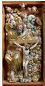
Detalle, retablo Trinidad