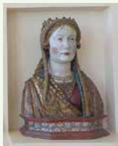
Busto relicario de una las Once mil Virgenes