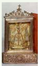
Peto limosnero de Nuestra Señora de las Ermitas