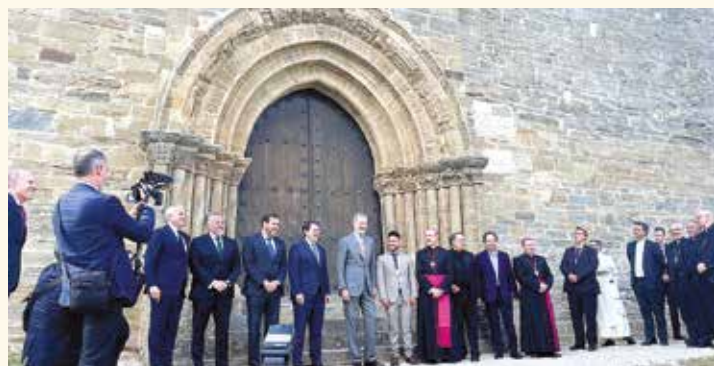
En la puerta del Perdón

La hospitalidad se asocia a la peregrinación. Todos somos peregrinos en este mundo, pero algunos lo son además en el sentido popular del término: peregrino es aquel que atraviesa los campos y se dirige a los santos lugares.