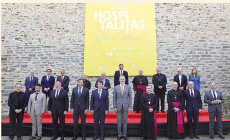
Imagen: Foto oficial de la inauguración con el Rey de España