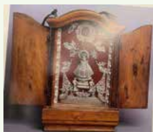
Peto limosnero de Nuestra Señora de la Carballeda