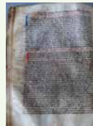
Tumbo Viejo de San Pedro de Montes