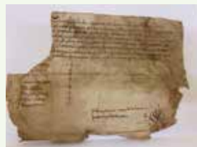
Alfonso VI absuelve de todo derecho regio a la iglesia de San Salvador de Foncebadón, sita en el monte Irago, y a los moradores de dicho Foncebadón