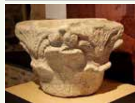
Capitel y can de modillones