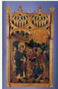
San Antonio Abad repartiendo limosna a los pobres