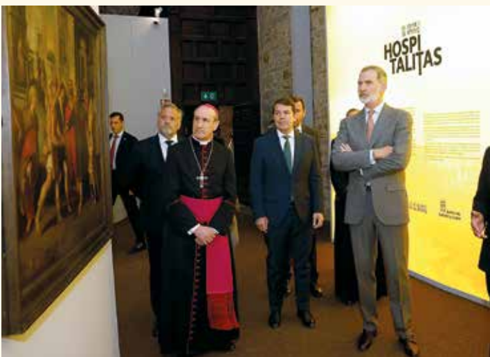
D. Jesús junto al monarca en la exposición

El obispo de Astorga recibía al monarca acompañado de autoridades políticas y eclesiásticas en un día que formará parte de la historia de esta villa berciana.