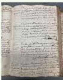
Libro registro del hospital de San Juan Bautista