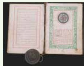
Libro de privilegios reales de Foncebadón