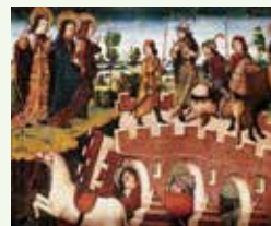
El Puente de la Vida y la Reina Lupa