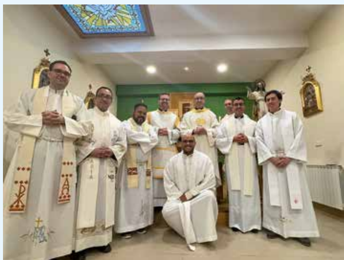
Sacerdotes jóvenes con el Sr. Obispo