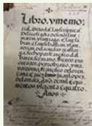
Ordenanzas de la cofradía de San Martín de los zapateros