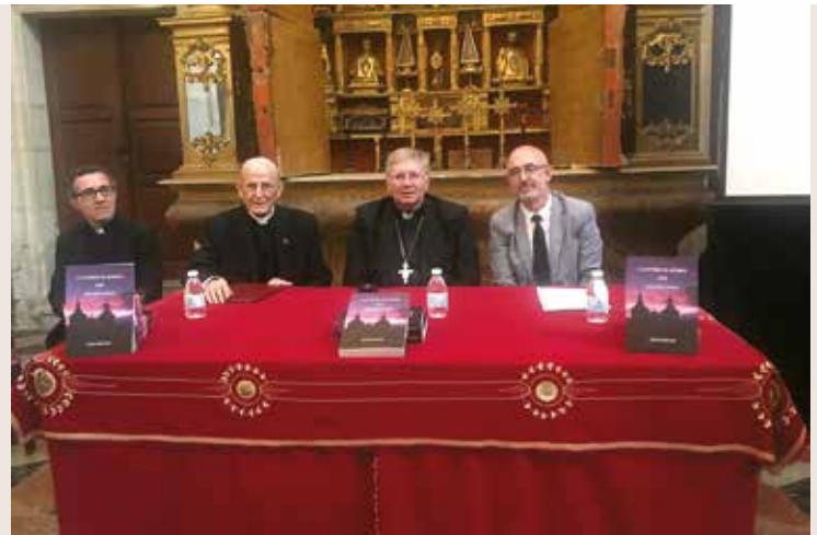
Presentación del libro.

A través de una gran recopilación de noticias de prensa de estos últimos 25 años, se muestra perfectamente el proceso de renovación que comienza en 1993, en la Capilla de San Juan, y finaliza a principios de este siglo.