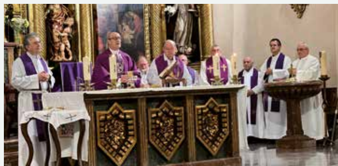
Un momento de la celebración

Una vez finalizada la celebración, tuvo lugar la despedida personal a todos los fieles a modo de agradecimiento en la puerta de la Iglesia.