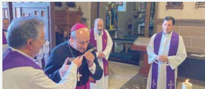
Veneración de la Santa Cruz