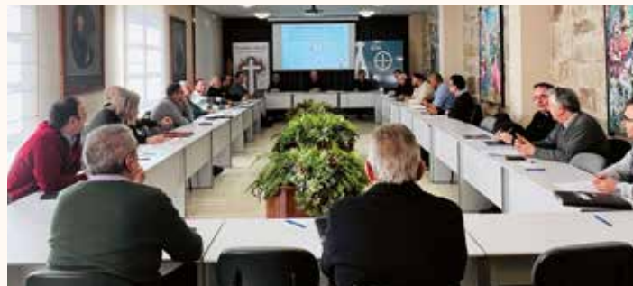
Un momento de la reunión

También se vieron propuestas de los consejeros sobre temas a tratar a fondo en futuras reuniones y, ya en la segunda parte del encuentro, se hizo la presentación del borrador de normativa diocesana sobre exequias; del balance económico 2024 y hubo un tiempo de informaciones varias del Sr. Obispo con tiempo para el diálogo.