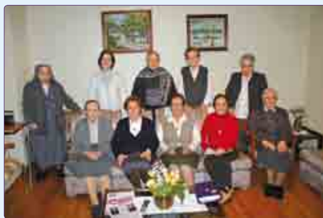
Comunidad de O Barco actualmente.

La comunidad de O Barco la componen actualmente 10 hermanas. Todas colaboran en el mantenimiento de la casa, tareas en el colegio y en la parroquia.