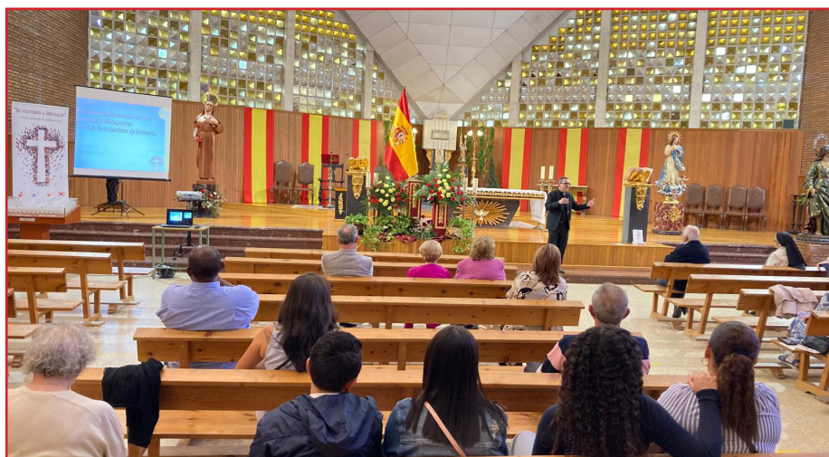
Envío para Galicia

En este segundo momento tuvo lugar el rito de envío, presidido por el administrador diocesano, con el que han sido enviados todos los agentes de Pastoral y miembros de la Escuela Diocesana de Evangelizadores (EDEU) presentes, con el que asumen la tarea de anunciar el Evangelio en sus comunidades a lo largo de todo el curso pastoral.