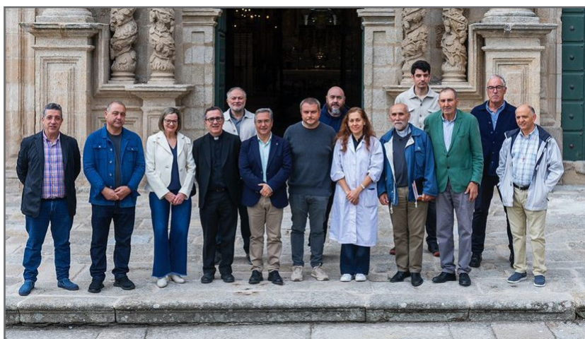
Asistentes a la visita

El Santuario de As Ermidas, situado en un entorno natural de gran belleza, es uno de los principales atractivos turísticos del oriente ourensano y un ejemplo del equilibrio entre fe, arte y patrimonio que caracteriza al interior de Galicia