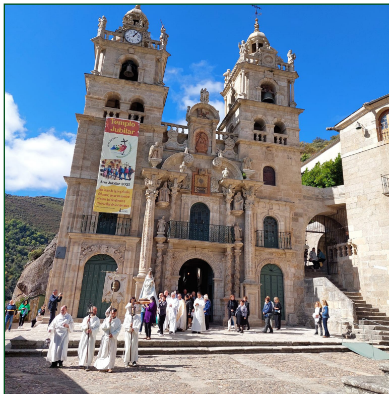
Procesión alrededor del templo

Esta conmemoración pretende reforzar la devoción, destacar el valor patrimonial del santuario y renovar su identidad espiritual como referente en el noroeste peninsular.