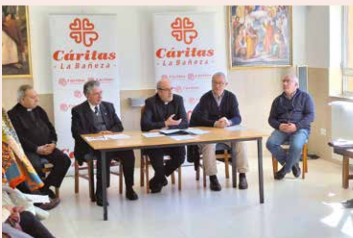
Un momento de la reunión