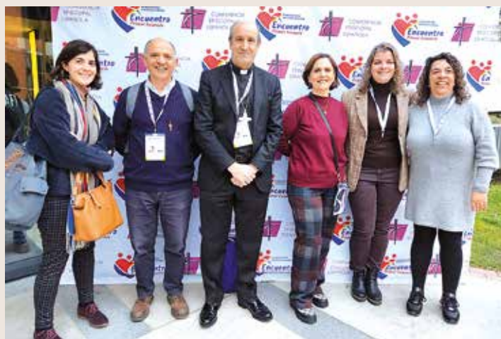
Representación diocesana en el Encuentro de Laicos

Entre los 1200 participantes estuvo presente una representación de la Diócesis de Astorga, presidida por nuestro Obispo D. Jesús. Se trató de resaltar la inmensa tarea de la Iglesia en el campo educativo. Concretamente se tuvieron en cuenta los siguientes ámbitos: Colegios, Profesores de Religión, Profesorado Cristiano, Centros de Educación Especial, Centros de Formación Profesional, Universidades y Centros Universitarios, Colegios Mayores y Residencias Universitarias, Educación no formal, voluntariado, tiempo libre, proyectos culturales y Parroquia - Familia - Escuela.