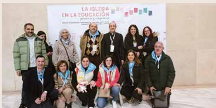
Participantes diocesanos en el Congreso sobre Educación

En realidad, el congreso empezó en octubre de 2023 con la presentación en todos estos ámbitos de distintas experiencias y proyectos. Los representantes diocesanos aseguraron que resultó muy interesante el compartir entre todas las diócesis y que este gran encuentro ha servido no tanto de clausura cuanto más de motivación a seguir trabajando en este campo tan apasionante.