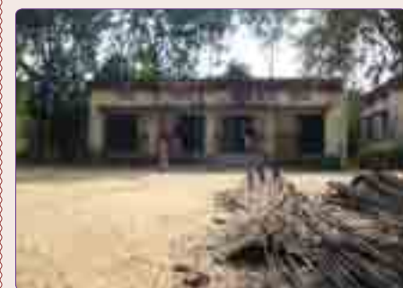
Colegio de Bartua con 900 alumnos. Tenían las clases en dos pabellones como el de la foto.

Experimentamos igualmente como L.U.C.Y. con las aportaciones de mucha gente, concienciada con la problemática india, ayuda a las hermanas de la Santa Cruz a salir adelante con todos y cada uno de los proyectos.