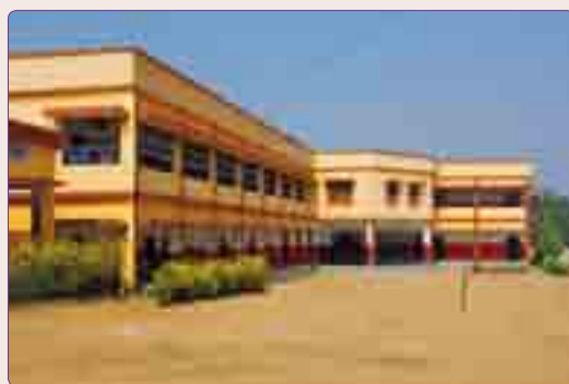
Colegio ya construido y en uso por los 900 alumnos.

Por cuarta vez el P. Gaspar y segunda yo, emprendimos esta nueva aventura hacia la India el pasado 13 de noviembre una vez más con la organización L.U.C.Y. y otros ocho amigos, volvimos para ver, palpar, comprobar, cómo esta organización trabaja por la niña india y todas sus necesidades.