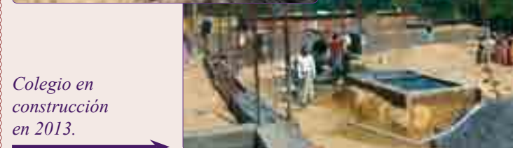
Colegio en construcción en 2013.

15 niñas recogidas de las calles de Bangalore, vagaban solas y algunas de ellas no tienen ni padre, ni madre. Las Hermanas de la Santa Cruz las cuidan y protegen pero les cuesta cada una de ellas 250 € al año, dinero que aquí no es nada pero allí suponen una cantidad muy importante.