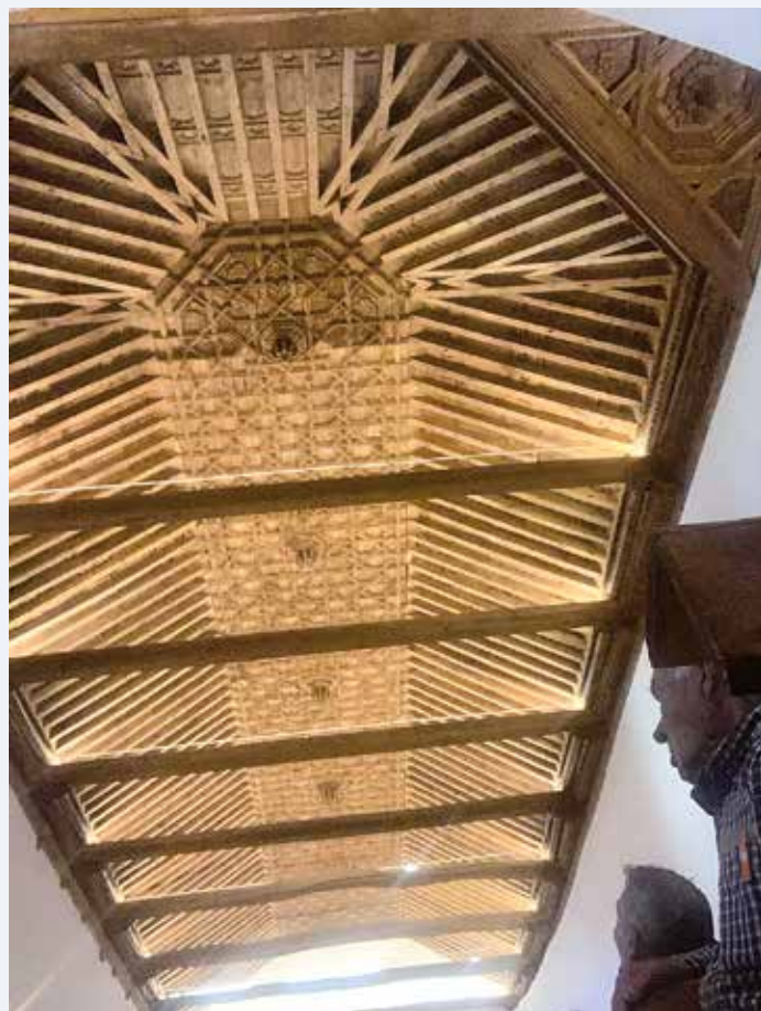
Imagen del artesanado recién restaurado