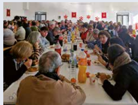
Durante la comida

La comida solidario – benéfica que celebramos el tercer domingo de adviento en nuestra UPA de Rivas del Sil organizada por nuestra Caritas, implica un generoso compromiso de solidaridad