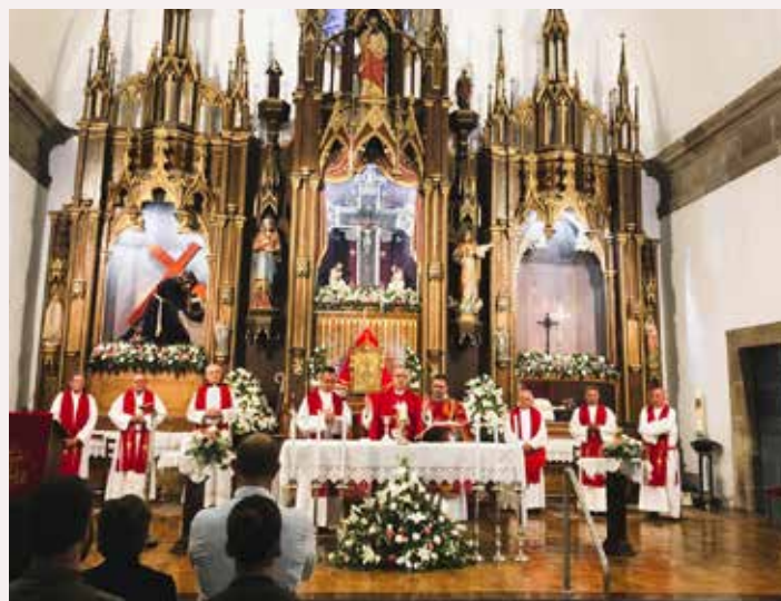
Un momento de la Eucaristía de la fiesta