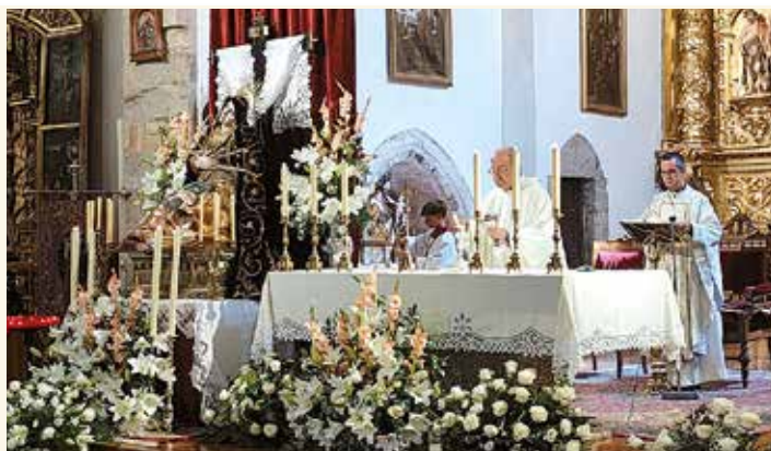
Un momento de la Eucaristía

Una vez finalizada la misma, se inauguró la exposición "DEVOCIÓN DOLOROSA", muestra que contiene todo lo que rodea el culto y la devoción a la Virgen de los Dolores. En ella está el ajuar de la Virgen, enseres de la Archicofradía, manteles, ropa litúrgica y candelabros que se usan para el culto a la Virgen, fotografías, medallas y otros objetos de propiedad privada de algunos devotos.