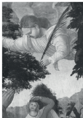
Tabla “Anunciación a los pastores”

detalle -estado inicial -proceso -estado final