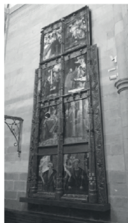
Retablo de Navianos. Capilla del Cristo de Las Aguas. Catedral de Santa Maria de Astorga. 8 TABLAS SUPERIORES - reproducción en fotografías a escala