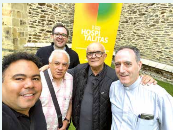
Los cinco sacerdotes de la UPA de O Barco

Un estupendo día que comenzó con la visita, en Villafranca del Bierzo, a la exposición HOSPITALITAS de Las Edades del Hombre. También tuvieron la oportunidad de acercarse a O Cebreiro y visitar el Milagro Eucarístico, en la iglesia de Santa María la Real, dentro de la diócesis de Lugo.