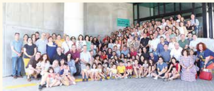
Participantes en el curso

Defensa de la dignidad de la vida en momentos y circunstancias difíciles de la misma. Mesa redonda sobre experiencias en acompañamiento de personas en situaciones de vulnerabilidad, dejando ver la pérdida de dignidad en las vidas de mujeres maltratadas, víctimas de la prostitución, etc. También en menores víctimas de un hogar desestructurado,