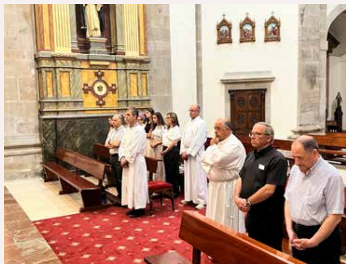
Tres candidatos vestidos con las albas