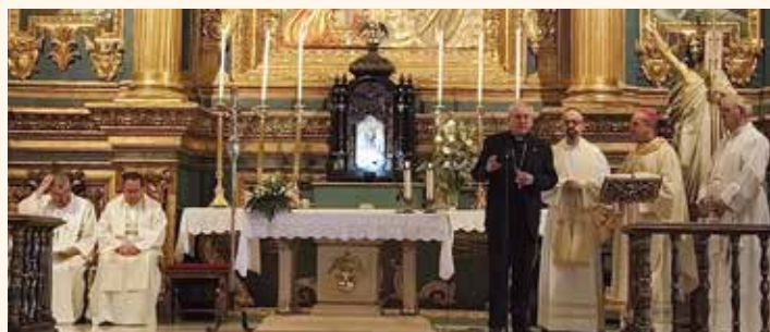
En Baños de la Encina

El último día de la Peregrinación, los 100 diocesanos con el Sr. Obispo se acercaron a BAÑOS DE LA ENCINA . Allí, tras la celebración la Eucaristía, y ser recibidos y acompañados por el párroco, autoridades civiles, representantes de la cofradía de la Virgen de la Encina, recibieron el saludo, antes de finalizar la misa, del Obispo de Jaén, D. Sebastián. Además, fueron acompañados a una almazara - cooperativa que lleva el nombre de Virgen de la Encina - donde fueron agasajados con aperitivos con aceite de este lugar.