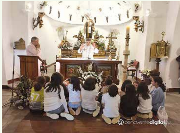
Bendición de los niños