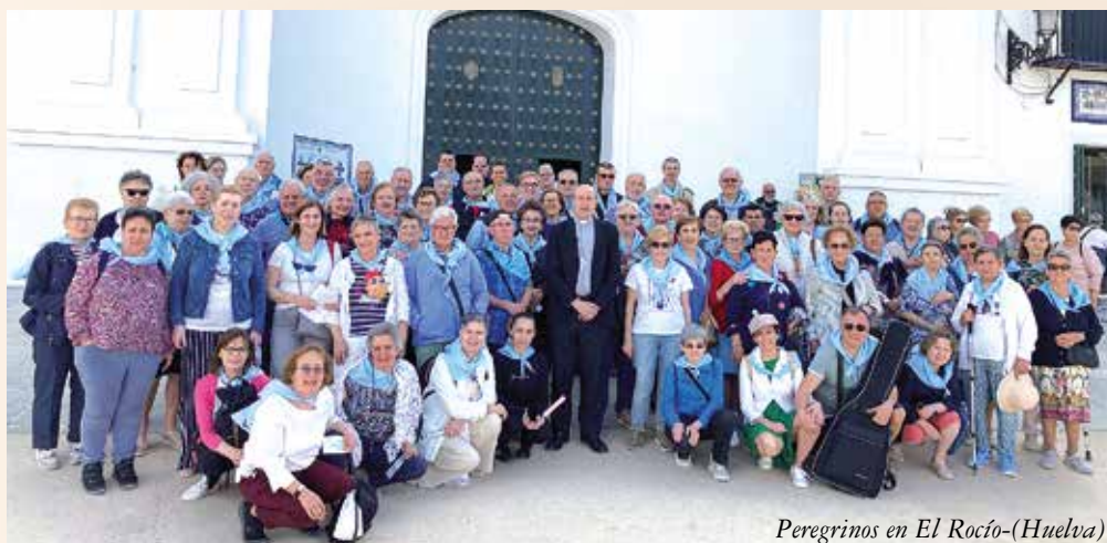
Peregrinos en El Rocío-(Huelva)