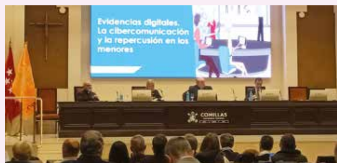
Un momento de las ponencias