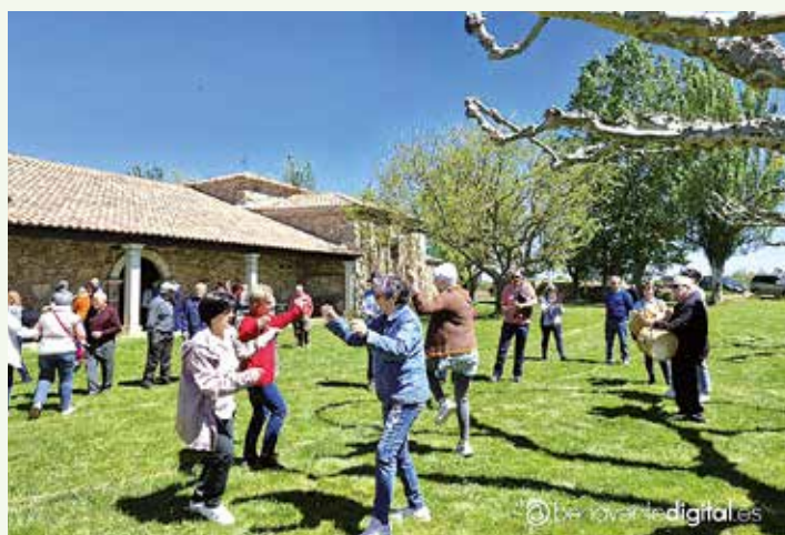
Bailes durante la convivencia