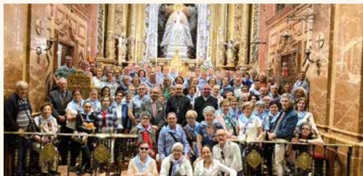
Foto de grupo en Sevilla

También en la capital andaluza pudieron contemplar el Guadalquivir, la Real Plaza de la Maestranza, la Torre del Oro, el Palacio de San Telmo, la Plaza de España, los Jardines de Murillo, el Barrio judío y los Reales Alcázares.