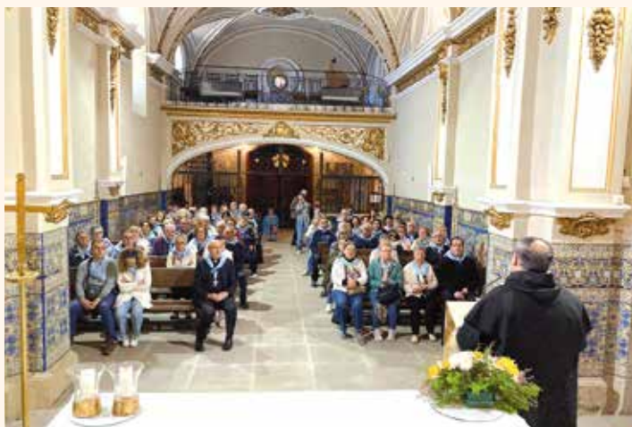
Recibimiento en Plasencia